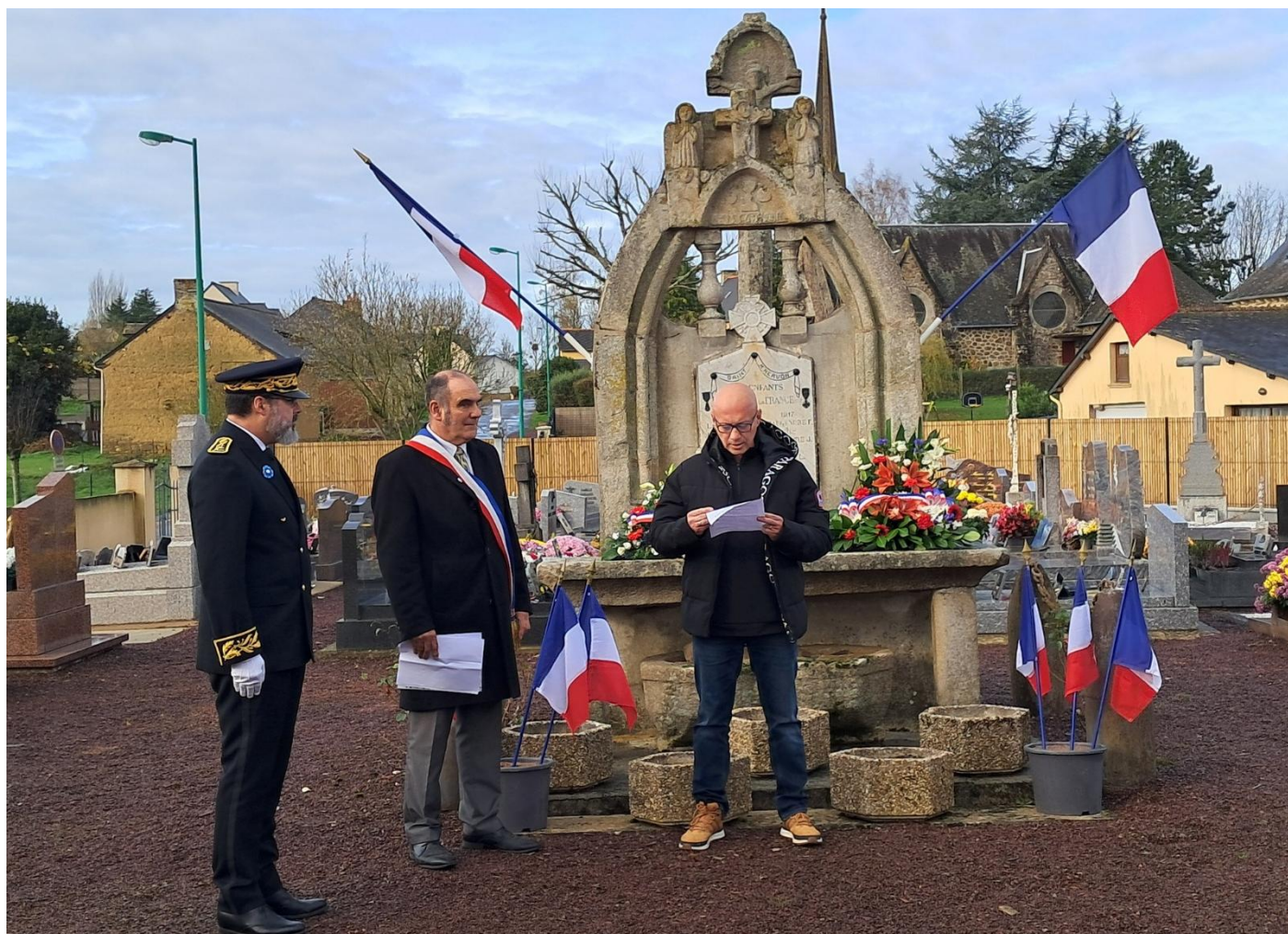
A la Chapelle du Lou du Lac,