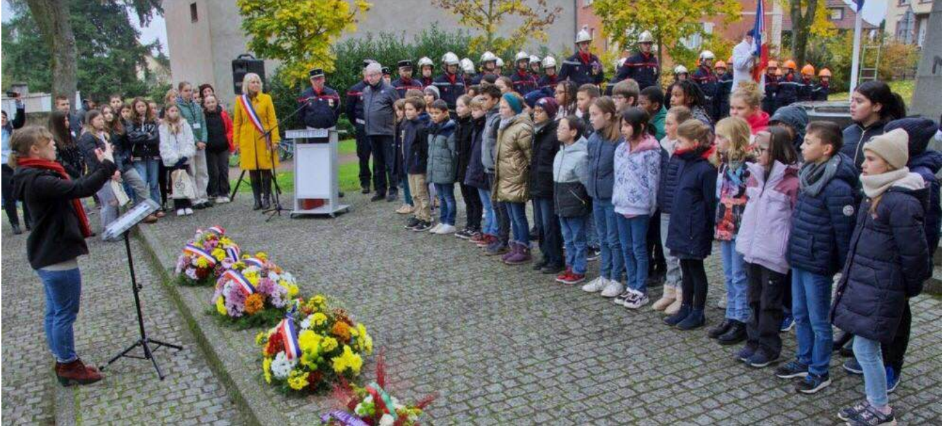
Près de 30 élèves CM1/2 de l'école de la Vallée ont chanté un poème de Paul Eluard.

- La cérémonie de commémoration de l'Armistice de 1918 s'est tenue à Barr devant le monument aux morts. Face au sacrifice des soldats tombés pour la liberté, la volonté de paix, d'unité et d'amitié entre les peuples fédérait le public présent pour entretenir la flamme du souvenir. – DNA - M. V. - 11 nov. 2024 à 19:56 | mis à jour le 12 nov. 2024 à 10:53 – Temps de lecture : 2 min