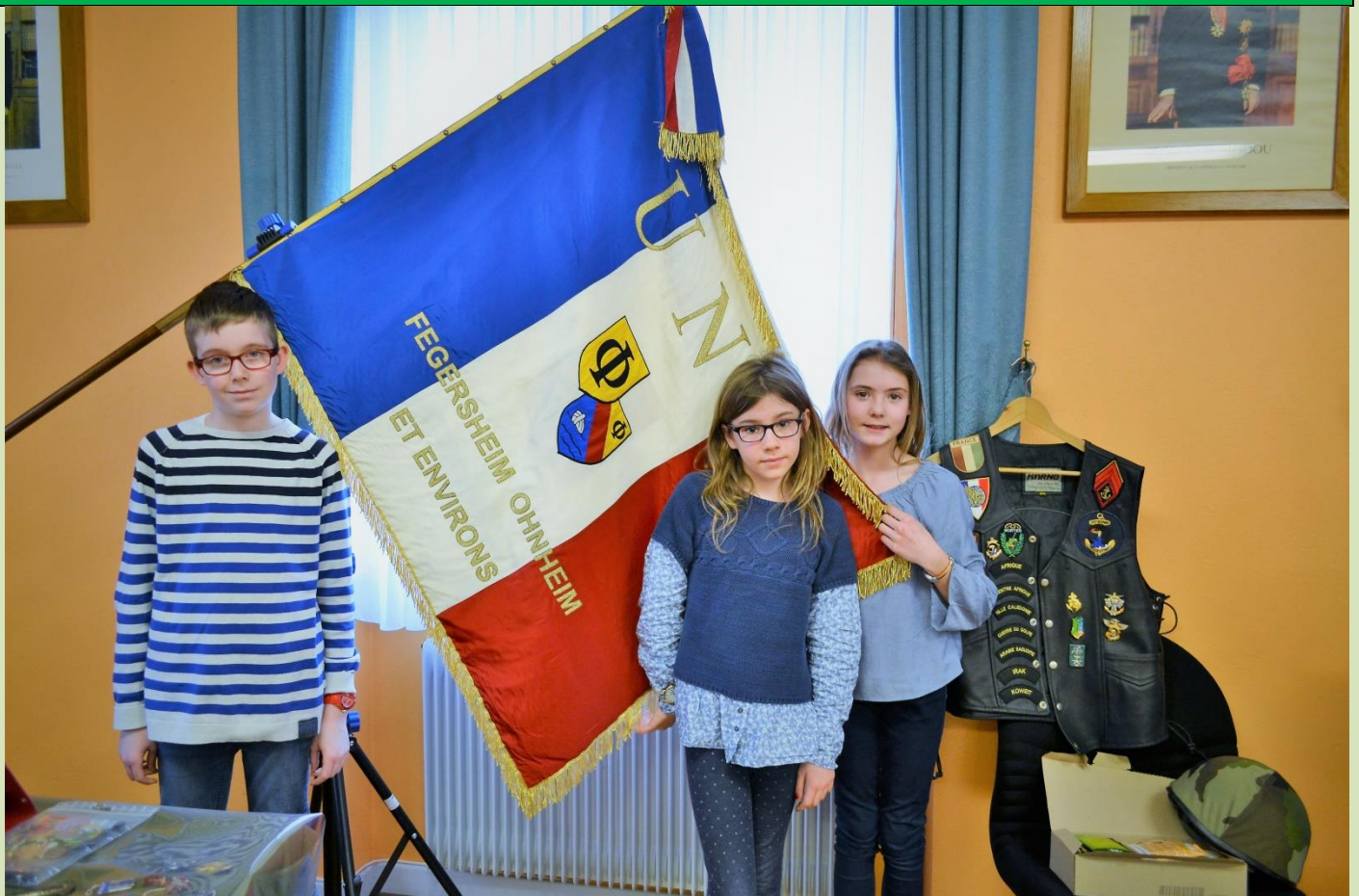
Les jeunes élus et le drapeau des anciens combattants.